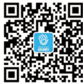
淡蓝公益 - 微信账号