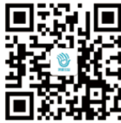
淡蓝公益 - 新浪微博